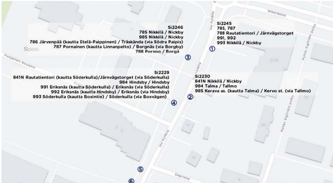
Pysäkit Iso kylätiellä