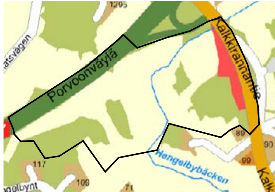
Kaavamuuotosalueen sijainti opaskartalla. Planändringsområdets läge på guidekartan.

Asemakaavan suunnittelualue sijaitsee Söderkullan keskustan eteläpuolella, Eriksnäsintien, Porvoonväylän ja Kalkkirannantien väliin jäävällä alueella. Se käsittää kiinteistöt 753-408-2-38, 753-408-2-41, 753-408-2-52, 753-408-2-47, 753-408-4-71, 753-408-4-78, 753-408-5-48, 753-408-5-65, 753-408-5-82 ja 753-414-3-153, sekä tiealueita. Suunnittelualueen pinta-ala on noin 32 ha.