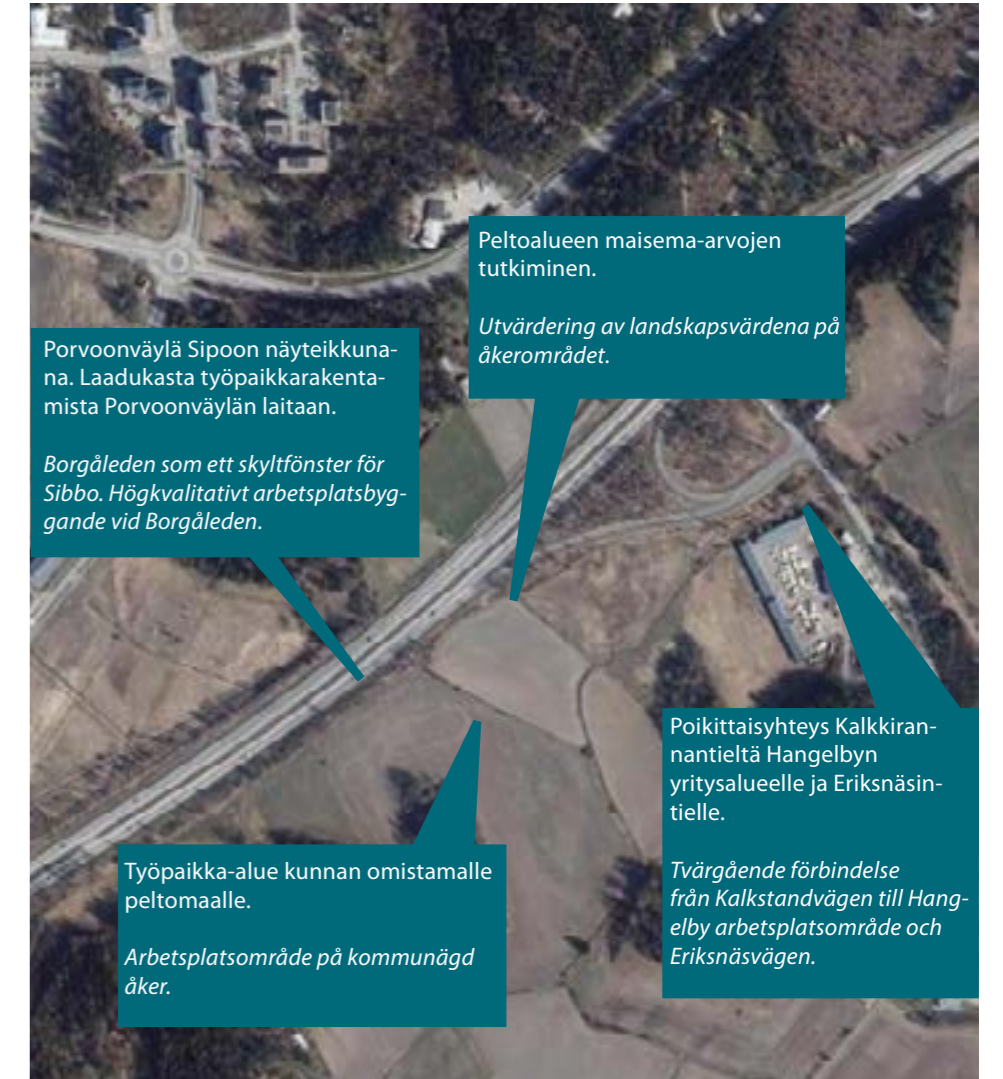
Kaavan alustavat tavoitteet. Planens preliminära mål.

Enligt målen i Generalplan för Sibbo 2025 växer Söderkullaområdet söder ut och denna plan bidrar till att verkställa generalplanens mål. Detaljplanens planeringsområde har i generalplanen anvisats för arbetsplatsbyggande (TP).